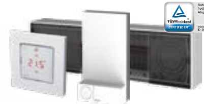
Danfoss Icon™ 24V MC/OTA Hauptregler Danfoss Icon™ Raumthermostat Zigbee Funkmodul