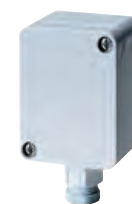
Fühler für Außenmontage Sensor for outdoor mounting