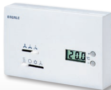
KLR-E 527 24