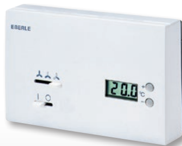
KLR-E 527 23